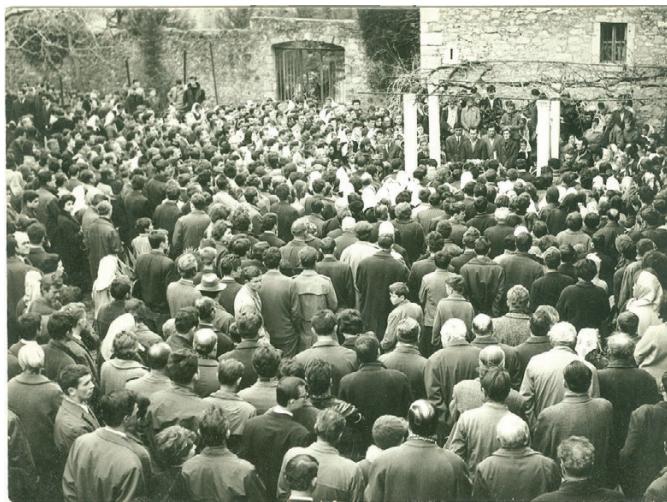
Sa sprovoda Vladana Desnice, 7. 3. 1967.