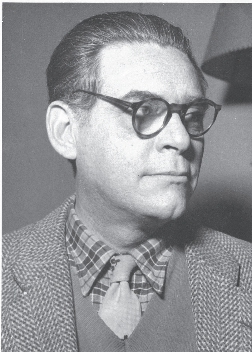
Vladan Desnica (Zadar, 17. rujna 1905. – Zagreb, 4. ožujka 1967.)