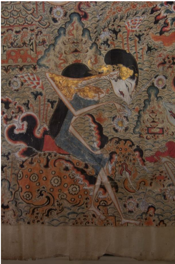
Detalj tradicionalnog wayang beber svitka

Izložba predstavlja rezultat etnografskog istraživanja dviju kulturnih antropologinja (Marina Pretković, Tea Škrinjarić) o indonezijskom tradicijskom kazalištu svitaka - wayang beber . Iako je dio tradicije lutkarskog kazališta i često se spominje u kontekstu preteče svjetski poznatog kazališta sjena wayang kulita , tradicionalne izvedbe wayang beber predstava ne koriste niti lutke niti sjene. Glavni rekvizit tog kazališta je šareno oslikani svitak namotan na bambusove štapove kojega, scenu po scenu, pripovjedač odmotava pjevajući priču uz glazbenu pratnju tradicijskih instrumenata gamelan orkestra. Iako se ovo tradicijsko kazalište smatra izumrlim, pojedini suvremeni umjetnici na Javi okupljaju se u kolektive sastavljene od slikara, glazbenika, pjevača, lutkara i plesača, koji zajedničkim naporima stvaraju nove inačice kazališta svitaka, pritom brišući granice tradicionalne forme izvedbe. Uz svitke koriste i različite rekvizite poput lutaka i maski načinjenih od otpada, u izvedbu uključuju video projekcije i ples, a uz tradicionalna kombiniraju i različita moderna glazbala.