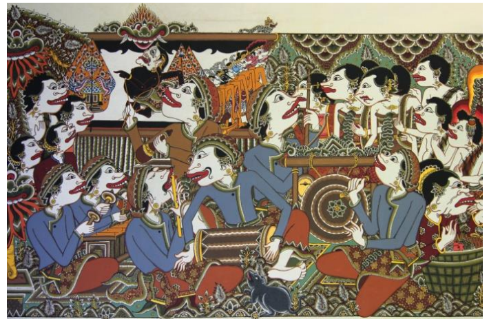
Primjeri suvremenih wayang beber svitaka